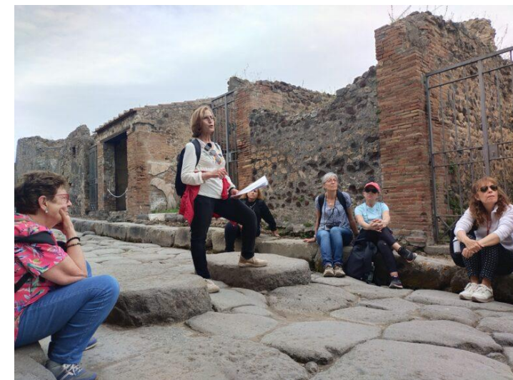
The students develop a project in English: Tourist guides for a day

During the mobility, students carry out a project in English, being tourist guides for a day in an emblematic place.