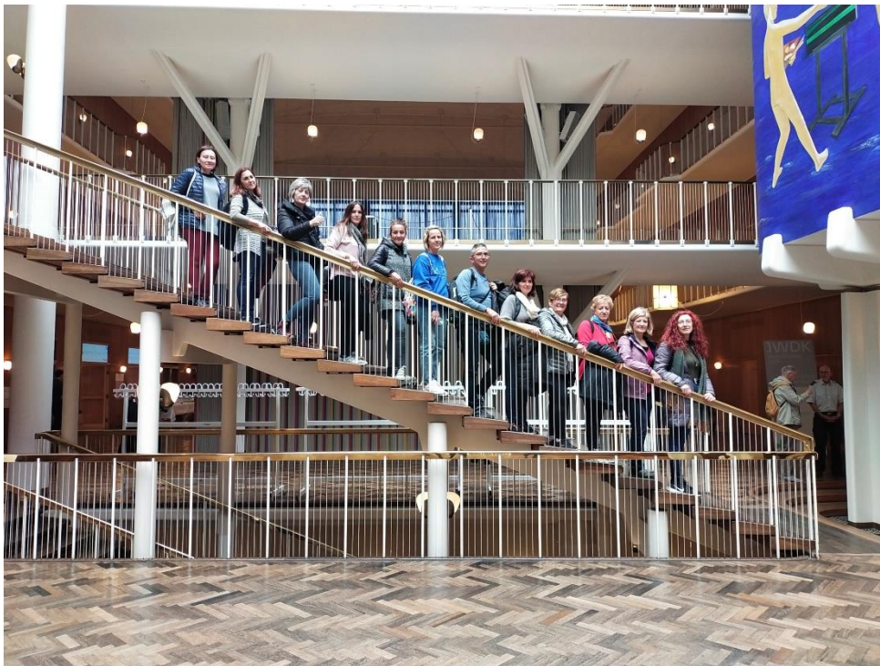
We visit the institutions and collaborations arise.