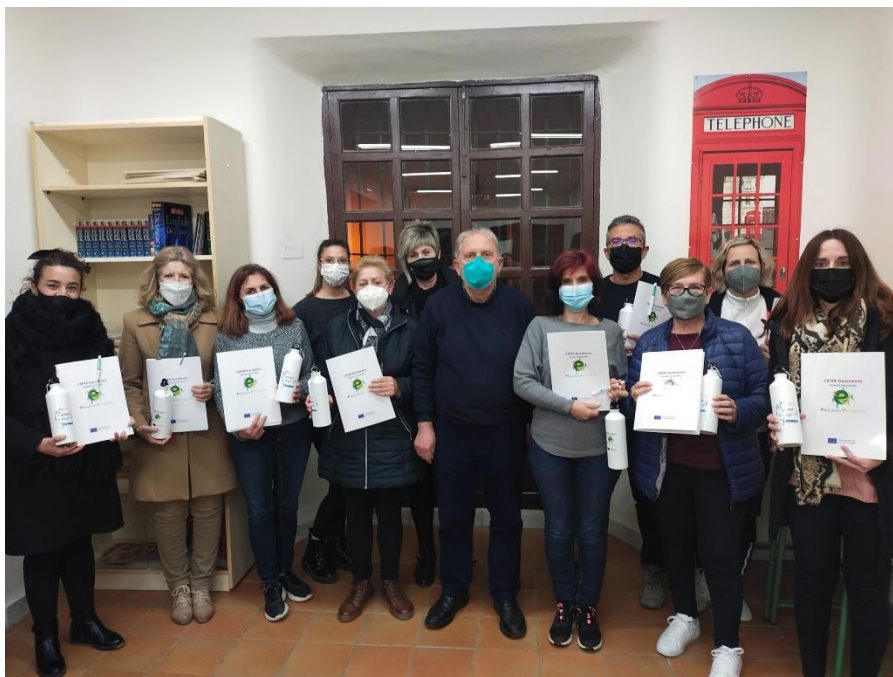
Face-to-face and virtual training meetings