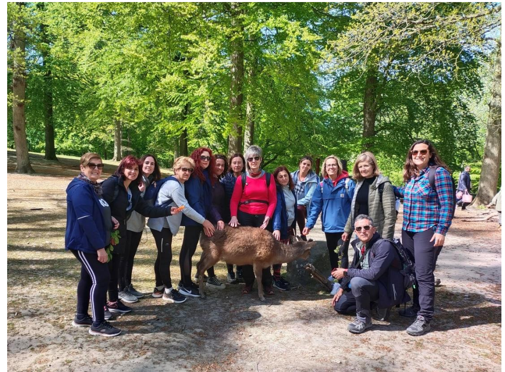
We cultivate a love for nature.