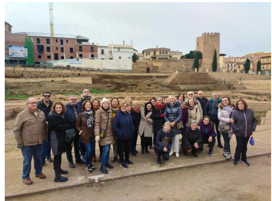
Motivating and formative activities in English during the first and second trimesters near our town